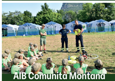
AIB Comunità Montana