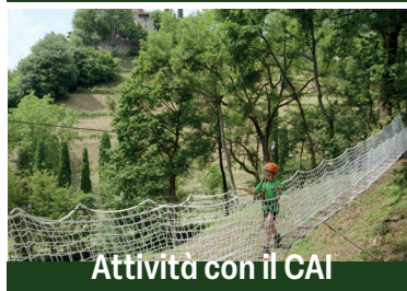
Attività con il CAI