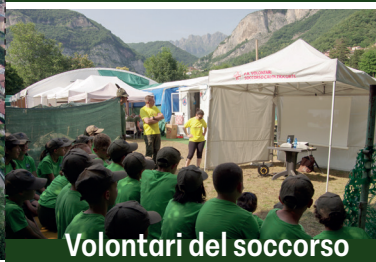
Volontari del soccorso