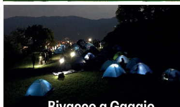
Bivacco a Gaggio