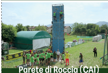
Parete di Roccia (CAI)