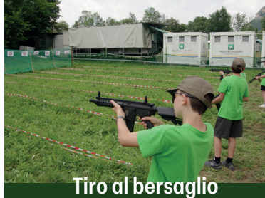
Tiro al bersaglio