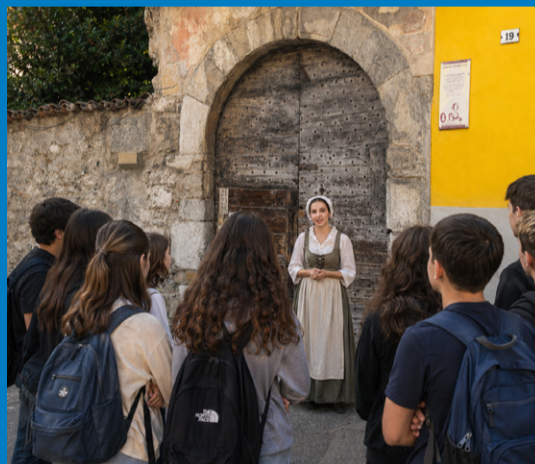
Restauro di tutti i luoghi