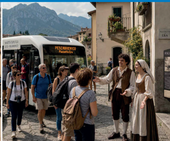
La navetta turistica dei luoghi letterari