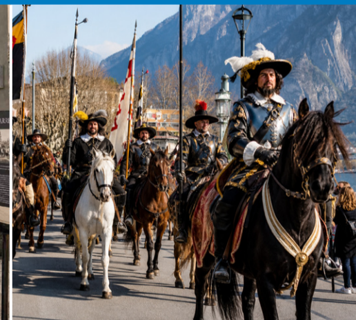
Il corteo Manzoniano, il grande evento POP.

LECCO CITTÀ LETTERARIA. L'identità si difende e si vive. Restauro, recupero, ricostruzione di tutti i luoghi e paesaggi letterari manzoniani, base della nostra IDENTITÀ cittadina e della nostra economia basata sulla cultura: dal Tabernacolo dei Bravi alla Casa di Lucia di Olate, da Pescarenico col Convento di Fra Cristoforo fino a Chiuso e al Castello dell'Innominato.