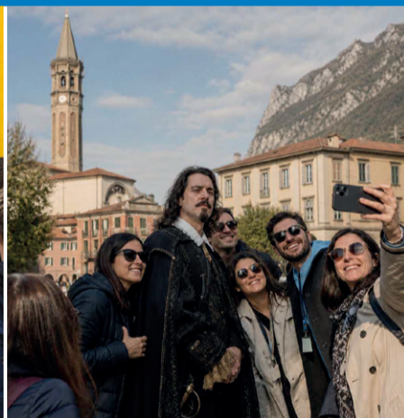
L'irresistibile selfie con Don Rodrigo